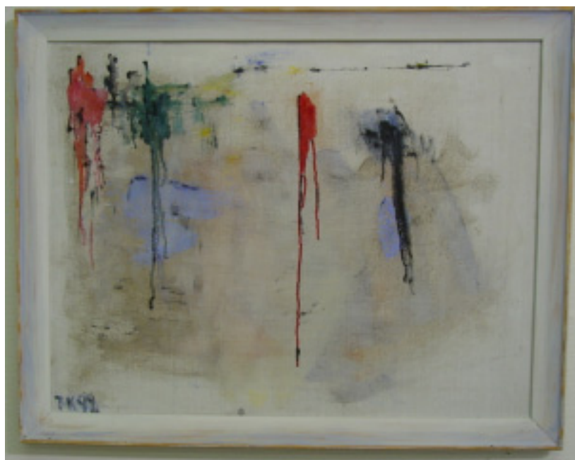
Den rinnande horisonten 1992

Tore Kurlberg blev oerhört glad när hans viktigaste instrument, ögonen, blev bra efter starroperationen. Han kände sig åter fri och nu släppte alla hämningar. Det är någon gång runt 1990, som hans abstrakta fas började. En abstraktion som han utvecklar så mycket att det i hans sista målningar från 1997-1998 bara finns antydningar till ett Skärhamn, som badar i ett värmande ljus. Om man jämför denna målning med Den Blå Kannan från 1989, så ser man tydligt hur abstraktionen har kommit in i hans konst.