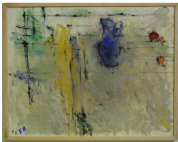
Den blå kannan 1989