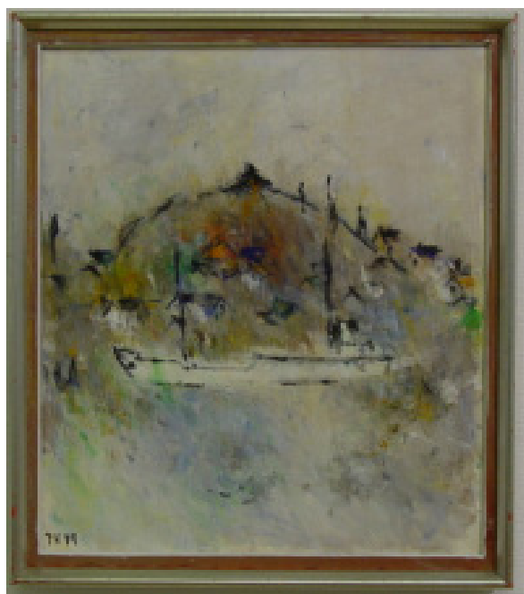
Den vita båten 1979

Nittionio procent av Tores målningar har blicken vänd mot väster. Hans boning i Hamnebergets slänt var avsatsen mot horisonten i väster. Detta är den enda målning vi funnit i hans kvarlåtenskap, där Hamneberget med de utefter bergsslutningen klättrande husen och den stora vita båten bildar motivet. Idén till motivet har han fått vid någon promenad i Södra Hamnen.