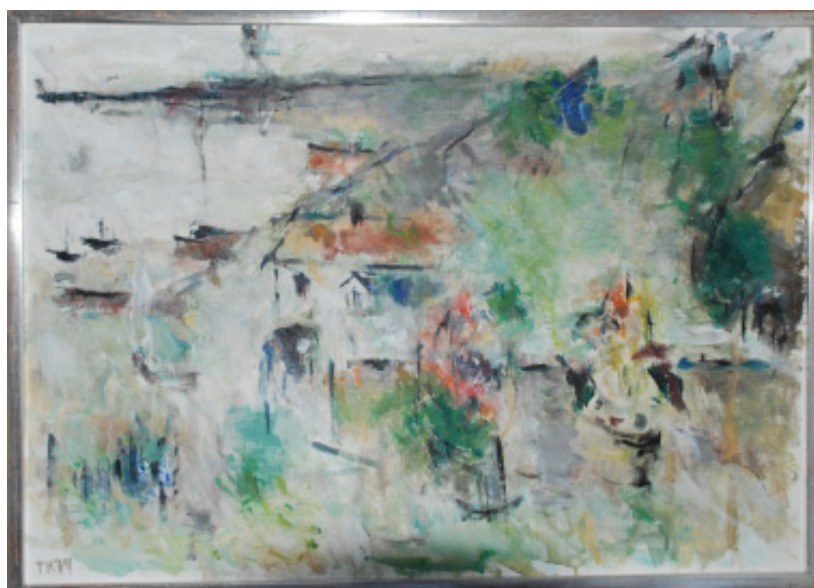
Bild över Skärhamn med utsikten från Tore Kurlbergs ateljéfönster målad 1979